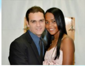
Met een kop koffie en een stuk gekookte maniok werd het interview afgesloten. Op bijgaande foto zij en hij op de dag van haar diploma-uitreiking in december 2017.

Nog zwaarder werd het voor mij toen mijn vader overleed. Enkele tijd later schreef de gemeente een vergelijkend examen uit voor het aanwerven van vastbenoemde functionarissen. Ik deed mee, slaagde, maar viel niettemin uit de boot. Daar stond ik nu zonder één roeie duit en met mijn studies halfweg. De reddende engel van het eerste uur, vastbesloten om mijn man te worden, zou alles in het werk stellen om me financieel en moreel te blijven steunen.